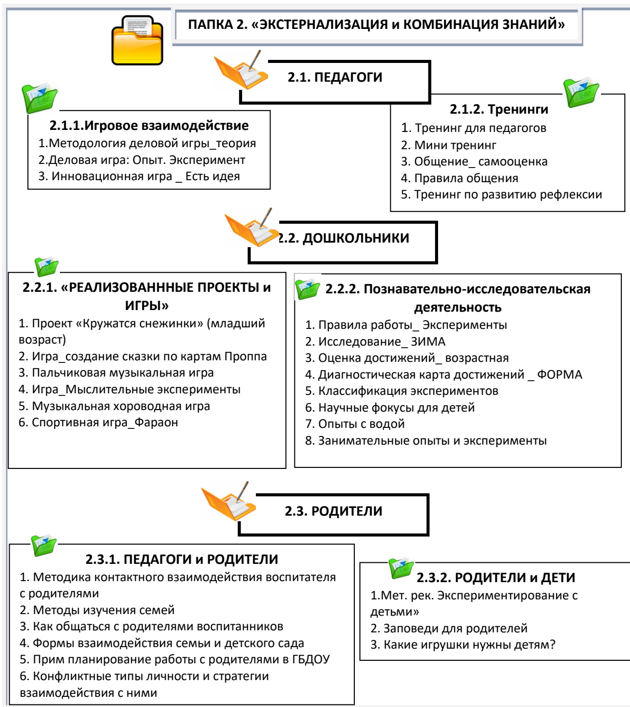
Рис. 2. Содержание папки «Экстернализация и комбинация знаний»

Термин «комбинация» – «переход» явных знаний в «используемые», этап создания новых знаний, структурирование их, размещение, сохранение т.д.